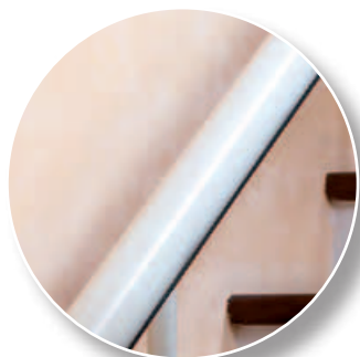
Ral 1013 crema - Marfil de serie