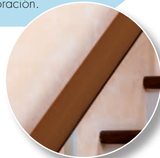
Ral 8024 Brun

El color del asiento y de la guía pueden ser elegidos entre una variedad propuesta, permitiendo al cliente armonizar la servoescaler Capri con su mobiliario y decoración.