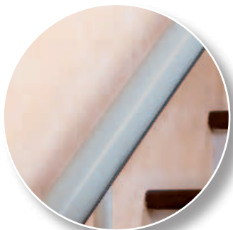
Ral 7047 Gris